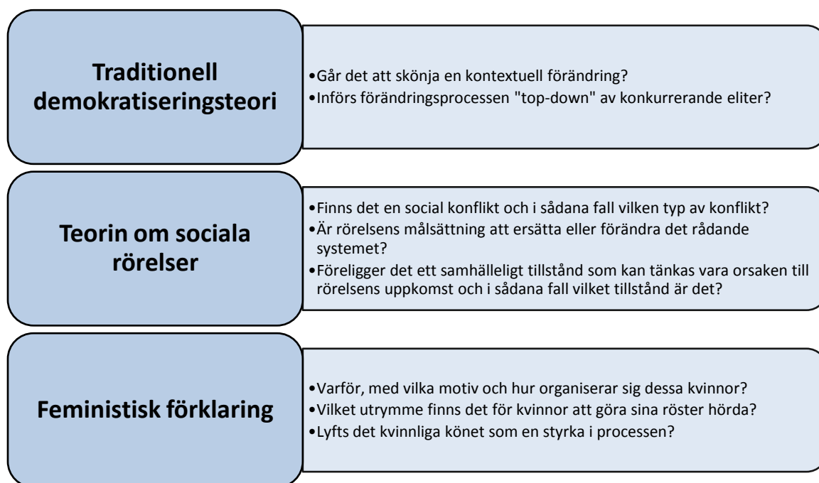
Figur 3. Analysverktyg som operationaliserar det teoretiska resonemangen till den empiriska analysen.