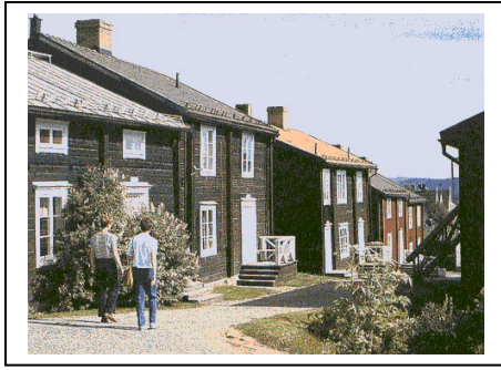
Vilhelmina Kyrkstad efter restaurering.

på 1940-talet som tog sig an mycket arbete 110 får anses ha del i att kyrkstaden idag är vad den är. Kanske var det tur för Vilhelmina att man inte hann göra något åt kyrkstaden innan 1960. För om så hade skett hade situationen kanske sett likadan ut idag som i Åsele. Detta kanske räddade den unika miljö som idag finns i samhället.